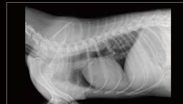
Tórax derecho, lat.