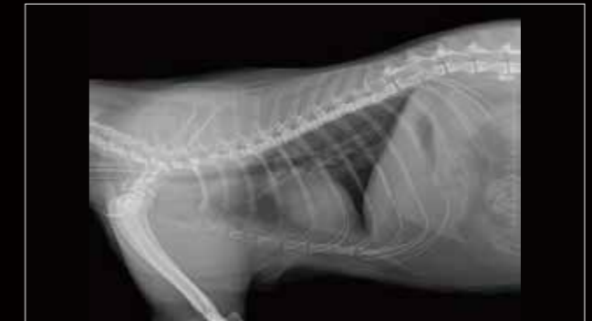
Tórax derecho, lat.