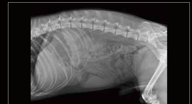
Abdomen izquierdo, lat.